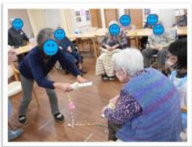
体を使ったゲーム