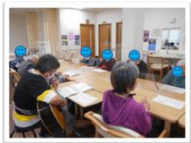
ギターに合わせて熱唱