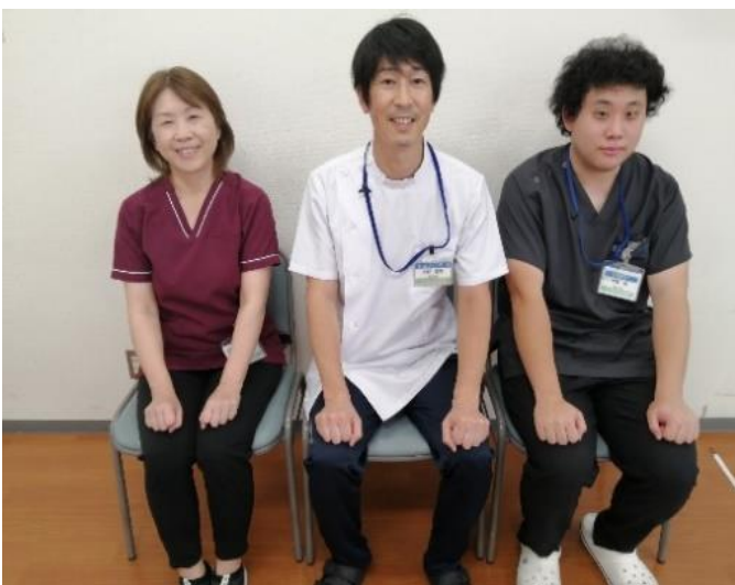
(通所/入院・外来/デイサービス担当)

こういった特長を活かして在宅療養支援病院としての機能の一端を担い、リハビリテーションを通して社会に貢献することをリハビリテーションセンターの理念としています。