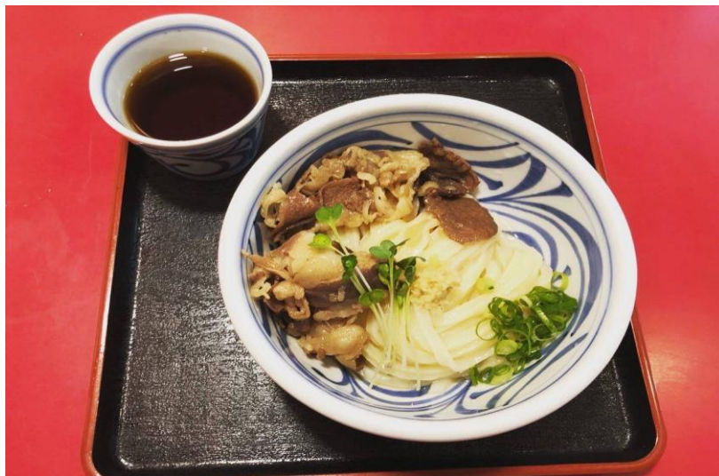
(香川の‘おか泉さん’の肉うどん)

私の趣味は車と運転、食べること、御朱印集めで、先日足を伸ばして車で四国にうどんを食べに行ってきました。食レポは出汁はしっかり、麺はもちりもちりで○亀製麺も最高ですが、本場の味は格別でした。今回は御朱印まで辿り着けなかったのも、また改めていくことを誓いました。随分人流も回復してきており、渋滞は嫌ですが今後も色々な所に出かけ、楽しい体験ができればと思います。