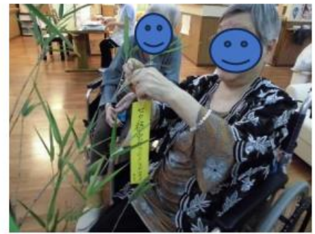
☆多七夕飾りを皆さんで作られました(o^ー^o)短冊に願い事☆多