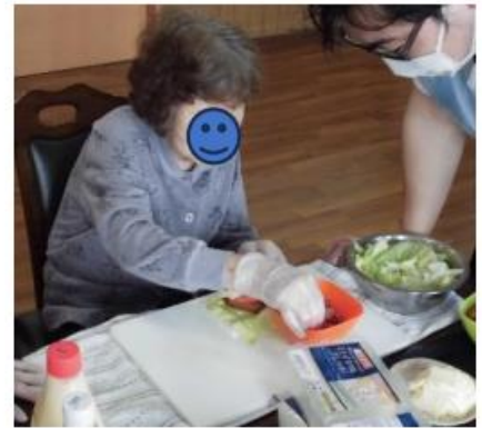
☆多皆でワイワイ作りながら食事レク☆多