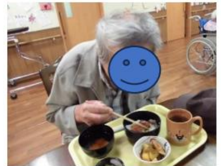
☆多夏は土用の丑(☺>.<☺)。♡鰻を頂きました☆多笑顔満開☆多